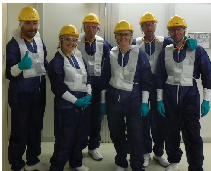
Visite de la centrale du Bugey par les élus

Pour les parents non mariés, afin d'établir la filiation, les parents, munis d'une pièce d'identité, doivent faire une reconnaissance (déclaration à l'état civil) dans n'importe quelle mairie avant la naissance de l'enfant.