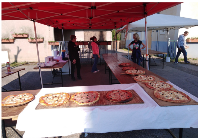
Stand de vente des tartes du sou des écoles

Les bénéfices de ces manifestations permettent de financer les projets scolaires (culturels, artistiques ou sportifs) des élèves du RPI.