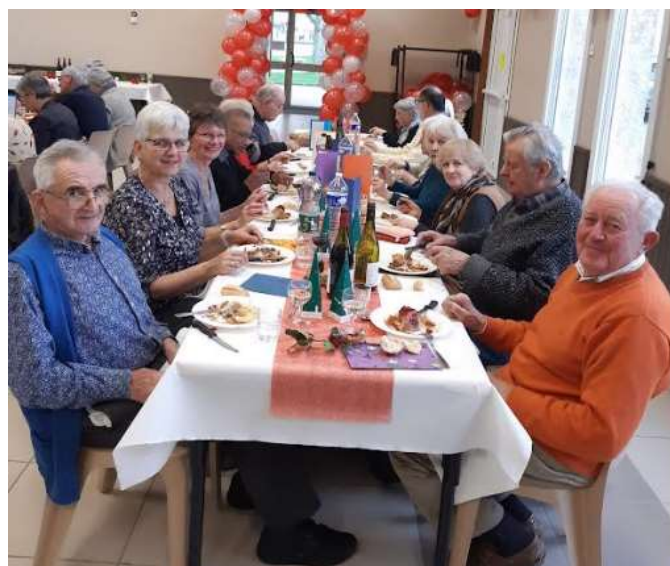
Repas du CCAS avec nos aînés

04 78 06 63 56 / mairie.lemontellier@gmail.com